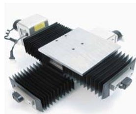
用两个旋转编码器的配合安装来实现螺旋轴的扩展