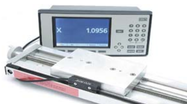
选择 1 或 5 \mu m 分辨率的线性编码器