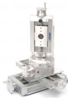
测量中等负载行程的四轴系统