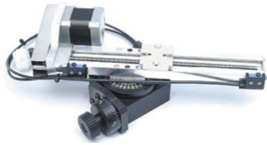
手动旋转表和机动工作台