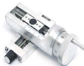
选择螺钉控制定位