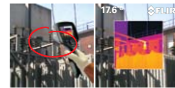
通过叠加画中画功能检测变压器