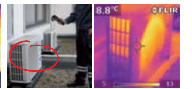
快速、轻松检查空调装置