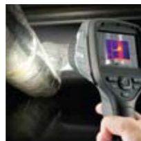
LED射灯，用于阴暗角落照明