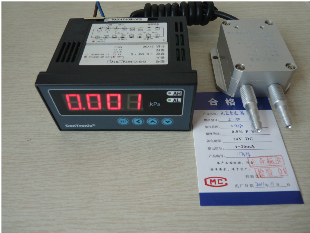
(以上图片为 TRD-CH6 数显表+ZT-150 传感器配套产品实拍图, 请参考)

ZT-150差压传感器配套智能数显控制仪 TRD-CH6, 可实现现场数字显示, 高低点报警输出 TRD-CH6详细资料详见下页