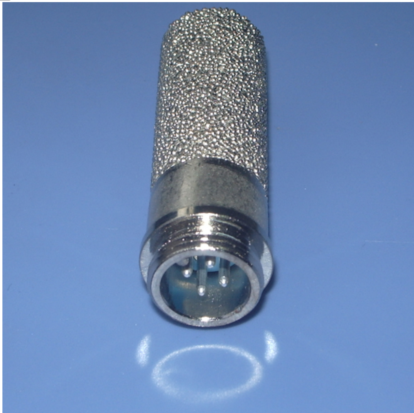
标准四芯接插件接口，更换维护更轻松