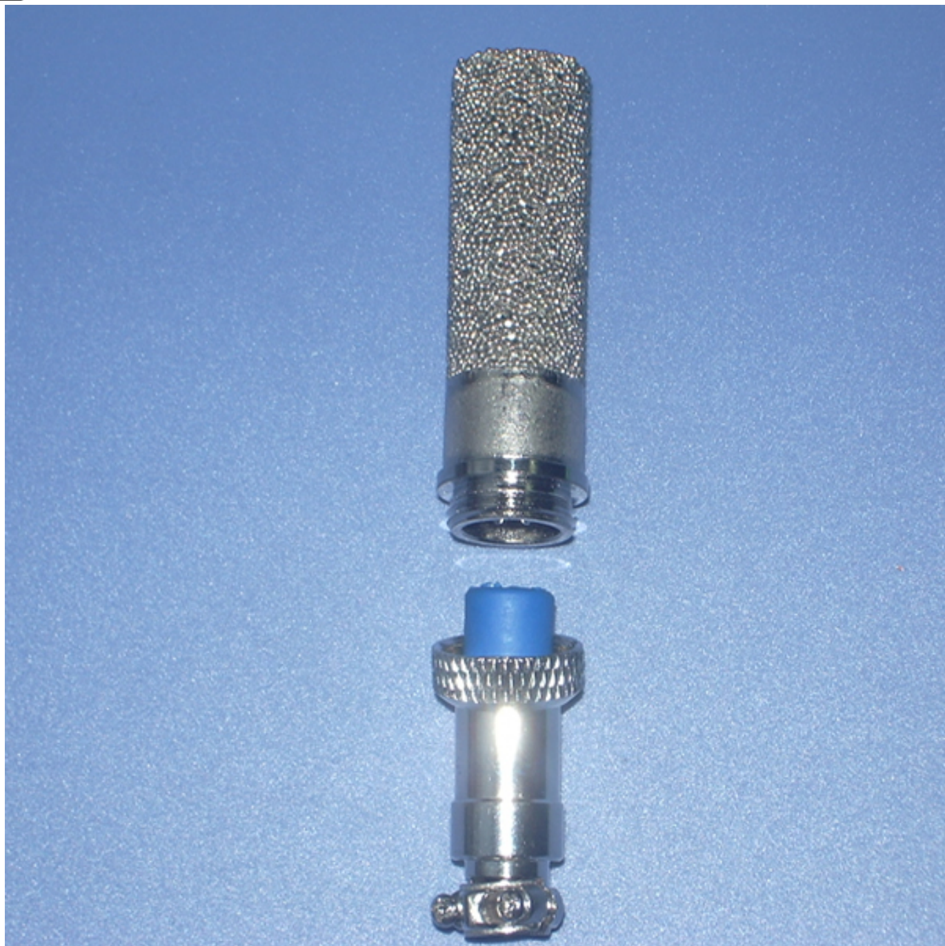
随时插拔，精度不够可随意更换

上海搜博实业有限公司是 http://www.cmosens.cn 指定总经销并常备现货，销售热线：021-51083595