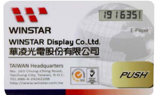
E-paper Smart Card 產品運用