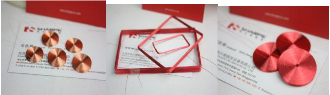
太阳能摇摆器线圈