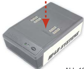
ALL-100A Base Unit