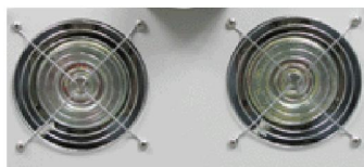
机器后部冷却风扇

F4N 的细节处理介绍： 作为威力泰独家研发生产及设计的第四代智能机型，我们数位工程师经过长达 6 个月上千次实验的结晶。也是继第三代智能回流焊 F3 之后的又一杰作。F4N 最初的定位更倾向最为实用的高端配置机型。我们在保证它有卓越品质及高端配置的前提下，更加注重客户的需要，更加能为客户节约成本。而且在细节的处理上也十分重视。比如棱角分明的外观设计，搭配上威力泰 V4.0 版本的控温系统，再加上焊接可视化窗口以及机器后部的排烟窗口的高密度活性炭海绵的装配，让这台机器几近完美。