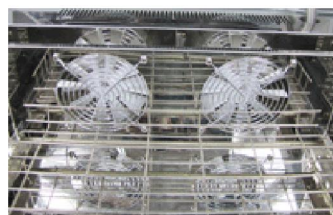
炉体热风循环系统