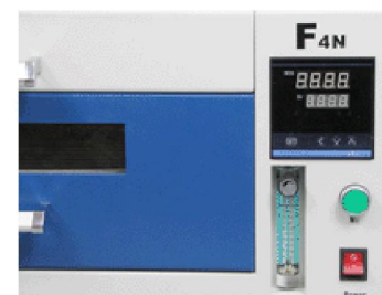
控温系统及氮气控制系统

F4N 的品质承诺： F4N 作为威力泰最新推出的精品高端机型，承诺每台机器出厂前均会有专业的高级工程师进行全方位的测试，保证产品的质量，同时我们还为这款机器提供长达一年的无偿保修服务，终身成本维修等特色服务。（易损件除外，如加热管）