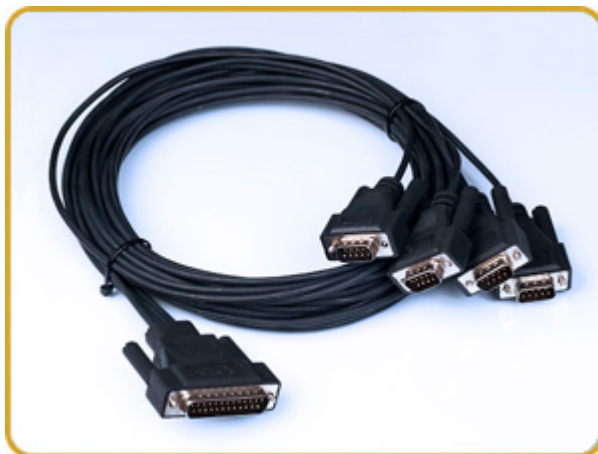
Kvaser Q-cable LSZH